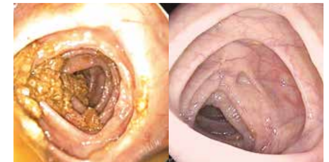
Ungereinigter und gereinigter Darm

... werden Sie noch ein bis zwei Stunden in unserem Aufwachraum überwacht, sofern Sie Beruhigungs- oder Schmerzmedikamente bekommen haben. Die Entlassung erfolgt in diesem Fall erst bei persönlicher Abholung in unserer Abteilung, da Sie bis zu 24 Stunden nicht verkehrstüchtig sind. Ggf. erhalten Sie für diesen Zeitraum der Arbeitsunfähigkeit einen Krankenschein.